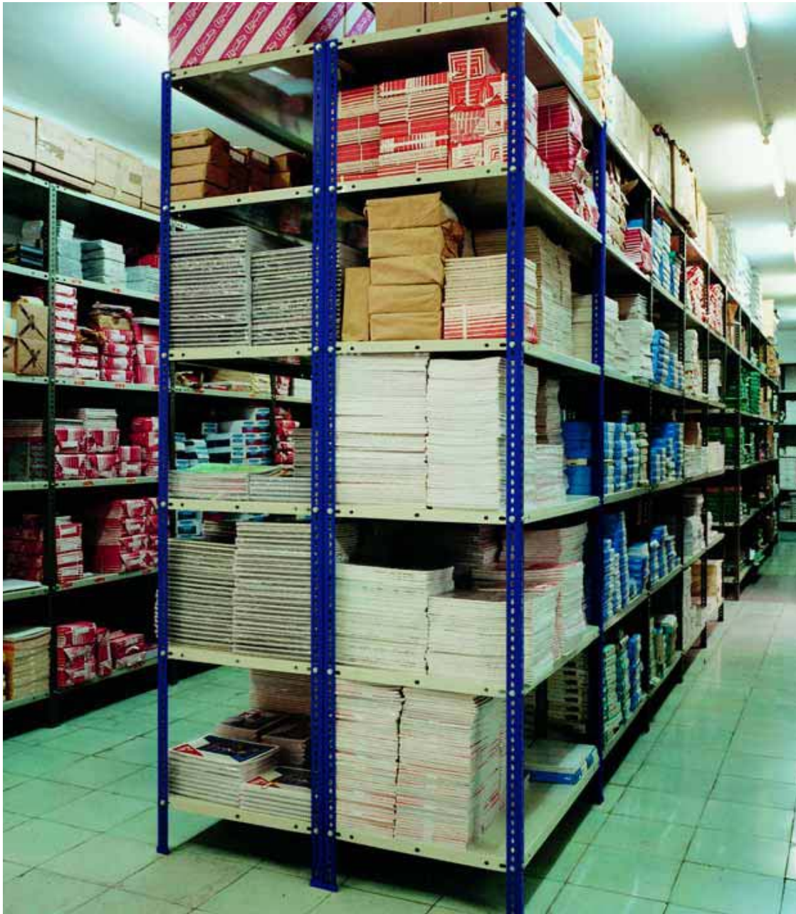
Estanterías de ángulo ranurado